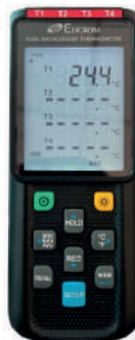
Datalogger de 4 canales

PVP equipo + cert. ISO 17025 $49,38 $46,91