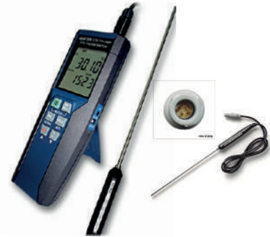
Termómetro patrón con PT100 1 sonda