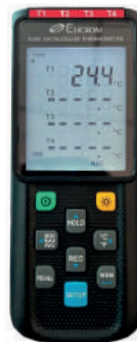
Datalogger de 4 canales