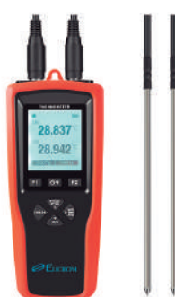
Termómetro patrón con PT1000 2 sondas