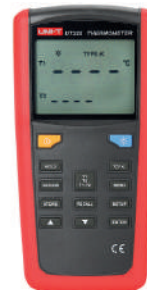
Termómetro digital de 2 canales