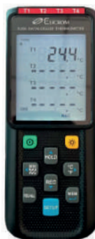
Datalogger de 4 canales