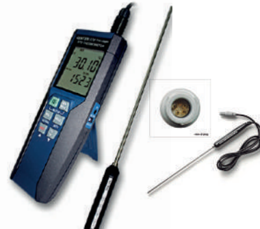
Termómetro patrón con PT100 1 sonda