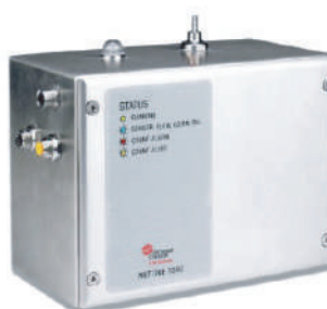
7015 Bomba de vacío externa