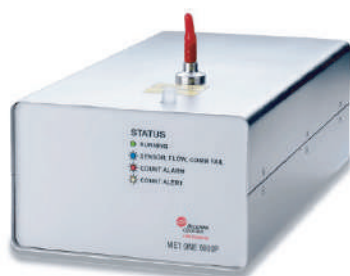
6015P Bomba interna incorporada