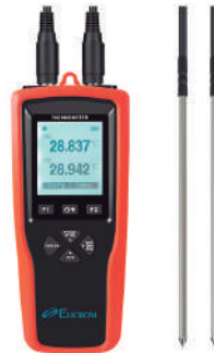
Termómetro patrón con PT1000 2 sondas