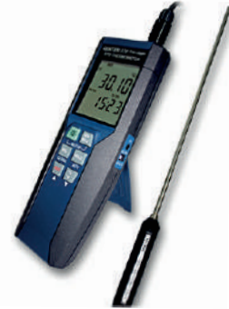
Termómetro patrón con PT100 1 sonda