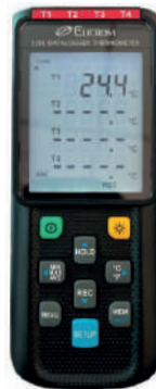
Datalogger de 4 canales