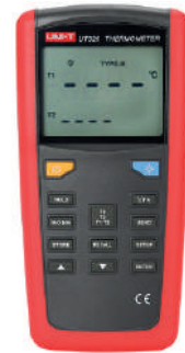
Termómetro digital de 2 canales