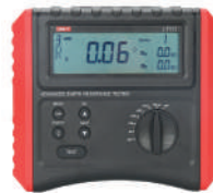
Probador de resistencia tierra