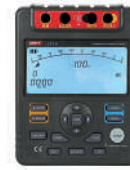
Probador de resistencia de aislamiento