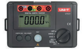
Probador de tierra