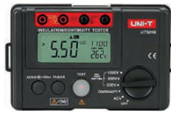
Probador de resistencia de aislamiento