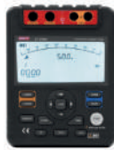
Probador de resistencia de aislamiento