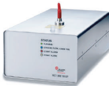
6015P Bomba interna incorporada